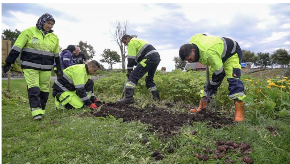
Frå språktrening og integreringstiltak på Gullvegen gardstun, Bømlo

Det er ikkje gjort systematisk kartlegging, sidan prosjektet skulle ha med kommunar med lite eller ingen Inn på tunet-aktivitet. Det tek tid å byggje opp eit tilbod, både for kommunane og for bonden.